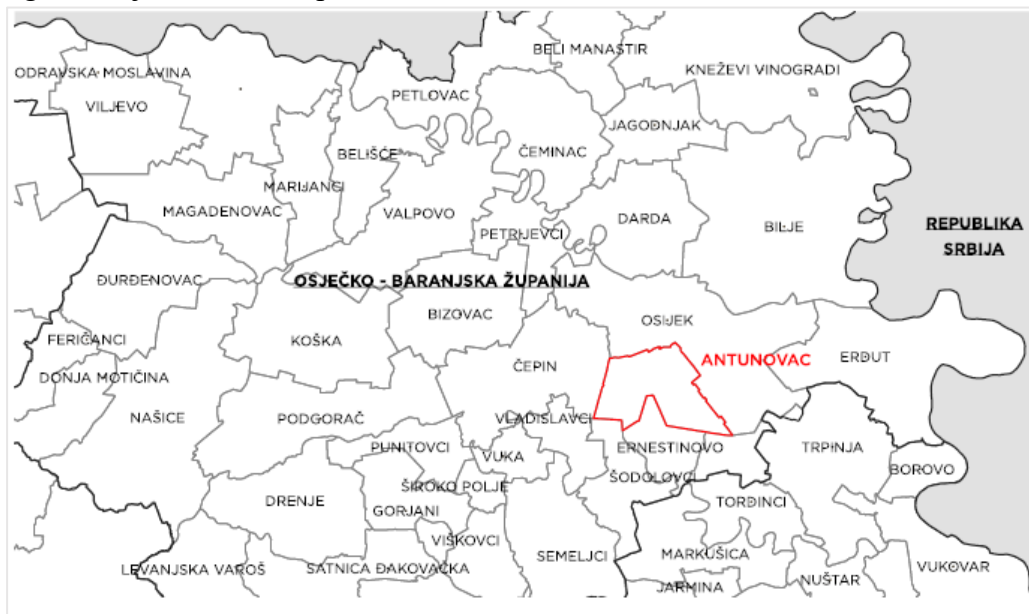
Položaj Općine Antunovac u Osječko-baranjskoj županiji

Prostor Općine Antunovac dio je šireg prostora na krajnjem istočnom dijelu Republike Hrvatske, odnosno njegove prirodno-geografske cjeline Istočne Hrvatske. Nalazi se na manjem jugoistočnom dijelu Osječko-baranjske županije te obuhvaća udjel od 1,4% ukupnog županijskog teritorija. Površina Općine Antunovac iznosi 57,26 km 2 .