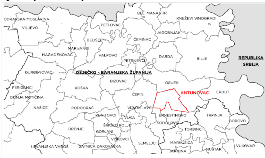
Položaj Općine Antunovac u Osječko-baranjskoj županiji

Prostor Općine Antunovac dio je šireg prostora na krajnjem istočnom dijelu Republike Hrvatske, odnosno njegove prirodno-geografske cjeline Istočne Hrvatske. Nalazi se na manjem jugoistočnom dijelu Osječko-baranjske županije te obuhvaća udjel od 1,4% ukupnog županijskog teritorija. Površina Općine Antunovac iznosi 57,26 km 2 .